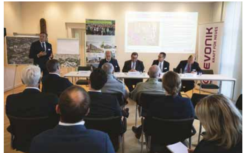
Pressekonferenz zum Projekt im November 2019

Ziel der Landmarken AG ist es, den modernsten Standort der Stadt zu schaffen. Dafür wird das Grundstück in drei eigenständige Abschnitte geteilt, von denen der mittlere die Bestandsgebäude beherbergt. Neu gebaut werden soll im nördlichen und südlichen Bereich des Grundstücks, um dort Start-up-Unternehmen, moderne Büro- und Laborflächen, Seminarräume für die Hochschule und ein Kongresszentrum anzusiedeln. Auch E-Mobilität, Bikesharing, Grünflächen und ein Fitnessbereich gehören zum Nutzungskonzept. Ein Bebauungsplan-Entwurf liegt der Stadt vor. Anfang September 2020 haben Stadtverwaltung und Ratspolitik damit begonnen, planungsrechtliche Voraussetzungen für den ITC-Bau zu schaffen. (MK)