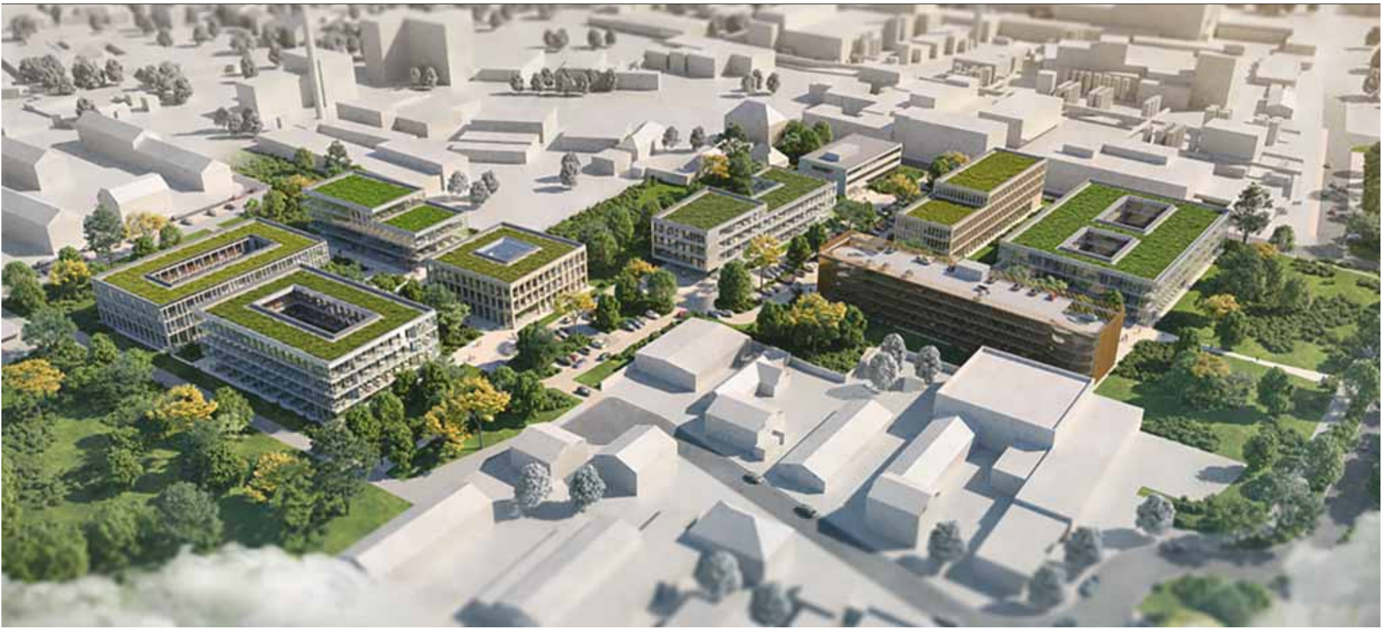
So könnte der künftige Innovations- und Technologiecampus Krefeld aussehen. Visualisierung: ASTOC Architects and Planners/rendertaxi